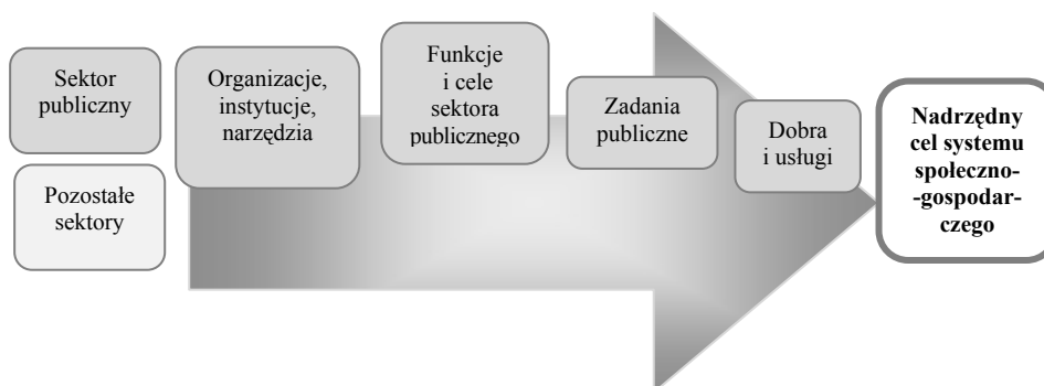
Rys. 1. Systemowe ujęcie roli sektora publicznego

Działalność sektora publicznego widoczna jest na poziomie państwowym, regionalnym oraz lokalnym, a racjonalne, skuteczne i efektywne jego funkcjonowanie przyczynia się do rozwoju społeczno-gospodarczego i podniesienia poziomu dobrostanu (w jego materialnych i niematerialnych aspektach), co można uznać za nadrzędny cel działania każdego systemu społeczno-gospodarczego. Sektor publiczny tworzy pewien system powiązanych ze sobą różnorodnych organizacji i instytucji, instrumentów i środków, które służą do wykonywania funkcji przypisywanych państwu (alokacyjnej, redystrybucyjnej, stabilizacyjnej) 1 i osiągania celów poprzez realizację zadań tworzącą dobra i usługi publiczne (rys. 1). Z tego powodu bardzo często w literaturze przedmiotu stosowane są zamiennie określenia państwo i sektor publiczny 2 . Tak jest w anglojęzycznych opracowaniach poświęconych badaniom efektywności sektora publicznego, w których określenia public sector oraz government (rząd, państwo) używane są jako synonimy 3 .