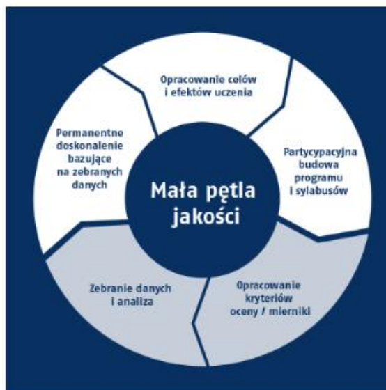
Rysunek 3. System doskonalenia jakości na Uniwersytecie Ekonomicznym w Katowicach - pętle jakości

Kierunek GT funkcjonuje zgodnie z powyższymi koncepcjami. Wpisuje się w misję i strategię UE KAT oraz w misję internacjonalizacji. Kierunek działa zgodnie z instytucjonalnymi i regulacyjnymi ramami wypracowanymi w uczelni, dążąc do wzmocnienia pozycji rynkowej na tle podobnych kierunków w kraju. Z drugiej zaś strony zapewnia się ciągłe doskonalenie programu studiów, przy udziale różnych grup uczestników – ze szczególną rolą Kuratora kierunku, odpowiedzialnego m.in. za nadzorowanie jakości kształcenia oraz rady programowej (obejmującej również przedstawicieli otoczenia gospodarczego) dokonującej analizy i oceny jakości kształcenia na kierunku w celu podjęcia ewentualnych działań doskonalących. Zakres zadań Kuratora, Menedżera Kierunku oraz Rady Programowej określa Uchwała Senatu Uczelni nr 129/2018/2019 wraz załącznikiem nr 1 zawierającym System zarządzania kierunkami studiów na UEKAT [Zał. VI-1].