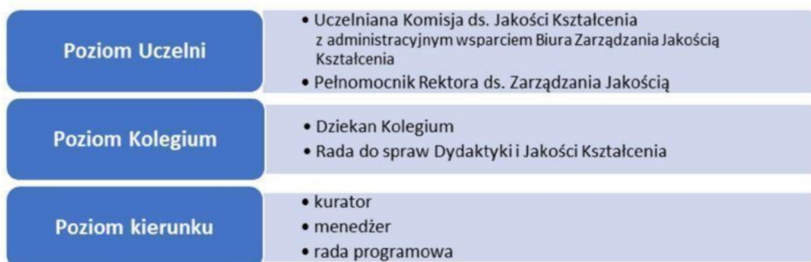
Rysunek 10.1. Poziomy zarządzania doskonaleniem jakości kształcenia na kierunku Logistyka w biznesie

Nadzór nad prawidłowymi działaniami w obszarze doskonalenia jakości kształcenia pełni Uczelniana Komisja ds. Jakości Kształcenia [Zał. X-1], która na poziomie organizacji inicjuje wewnętrzne uregulowania prawne, nadzoruje proces badania opinii studentów oraz analizuje raporty kuratorów kierunków. Przynajmniej raz w roku na posiedzeniu Uczelnianej Komisji ds. Jakości Kształcenia (której członkami są również przedstawiciele studentów) jest dokonywany kompleksowy przegląd poszczególnych procesów objętych Systemem Jakości oraz uwarunkowań jego funkcjonowania. Sprawdzana jest kompletność systemu w kontekście dostarczania narzędzi zapewniania jakości kształcenia oraz skuteczność stosowania tych narzędzi i procedur zapewniania jakości - adekwatnie