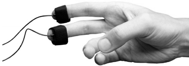
Rys. 3. Przykładowe umieszczenie elektrod podczas badania odruchu skórno-galwanicznego