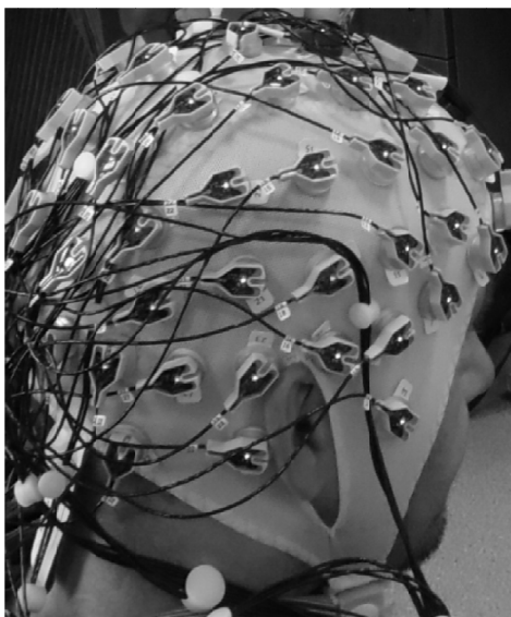
Rys. 2. Czepek z aktywnymi elektrodami EEG

Istnieje wiele metod, których celem jest zrozumienie i interpretacja aktywności bioelektrycznej mózgu. Jednak wśród tych metod badawczych elektroencefalogram (EEG) wyróżnia się najdłuższą historią zastosowań, najniższym kosztem, całkowitą nieinwazyjnością i najwyższą rozdzielczością czasową. Urządzenie EEG rejestruje aktywność elektryczną kory mózgowej. Rejestracji aktywności mózgu dokonuje się przy pomocy specjalnych elektrod przyczepianych za pomocą żelu lub pasty do powierzchni skóry głowy lub za pomocą elektrod przyczepionych do czepka, który następnie zakłada się na głowę osoby badanej (rys. 2).