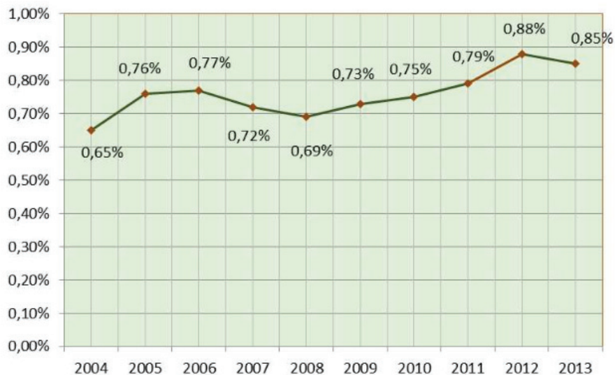
Rys. 1. Udział planowanych wydatków cz. 24 – Kultura i ochrona dziedzictwa narodowego w ogólnych wydatkach budżetu państwa w latach 2004-2013

W strukturze dochodów i wydatków budżetu państwa na 2013 r. wielkości określone ustawą dla cz. 24 – Kultura i ochrona dziedzictwa narodowego, stanowiły znikome wielkości. Udział dochodów cz. 24 w dochodach budżetu państwa wynosił 0,006% (przy 0,002% w 2012 r., 0,005% w 2011 r., 0,002% w 2010 r., 0,002% w 2009 r.). Udział wydatków cz. 24 w wydatkach budżetu państwa wynosił z kolei 0,85% (przy 0,88% w 2012 r., 0,79% w 2011 r., 0,75% w 2010 r., 0,73% w 2009 r.) [Ministerstwo Kultury i Dziedzictwa Narodowego, 2013, s. 2]. Rysunek 1 przedstawia zmiany w wielkości planowanych wydatków na przestrzeni lat 2004-2013. Należy podkreślić, iż od 2004 r. (z wyjątkiem lat 2007 i 2008) udział planowanych wydatków na kulturę w ogóle budżetu państwa wzrastał, co z punktu widzenia jednostek kultury jest zjawiskiem pozytywnym.