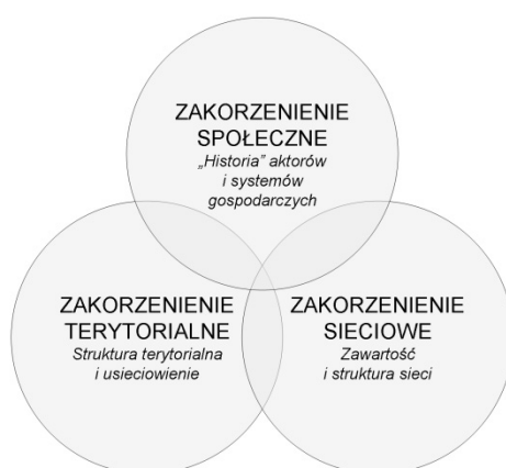
Rys. 2. Podstawowe kategorie zakorzenia

korzenie społeczne tworzy szeroko rozumiana historia i dziedzictwo, jakie otrzymujemy w miejscu, w którym funkcjonujemy. To m.in. kontekst kulturowy, ramy instytucjonalne i regulacyjne, cechy środowiska społecznego, z którego pochodzi aktor. Zakorzenie sieciowe definiuje się przez pryzmat relacji i sieci powiązań, w których funkcjonuje dany podmiot (kapitał relacyjny). Zakorzenie terytorialne to przywiązanie działalności aktorów do konkretnego miejsca, w którym współtworzą kumulatywną informację i wiedzę oraz nowe zasoby strategicznie dla nich wartościowe [Grzesiuk, 2015].