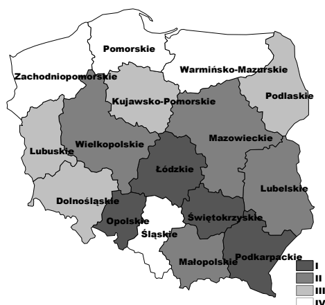
Rys. 1. Poziom życia na obszarach miejskich z wyłączeniem miast-stolic – metoda klasyczna i pozycyjna

Objaśnienia: MK – miernik klasyczny, MP – miernik pozycyjny.