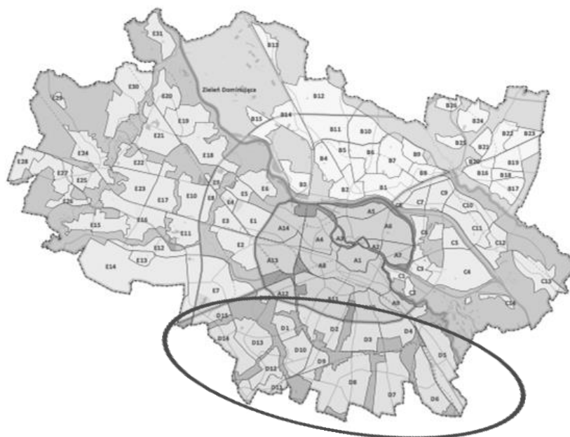
Rys. 1. Dzielnice i jednostki urbanistyczne Wrocławia z wyróżnieniem dzielnicy urbanistycznej Południe